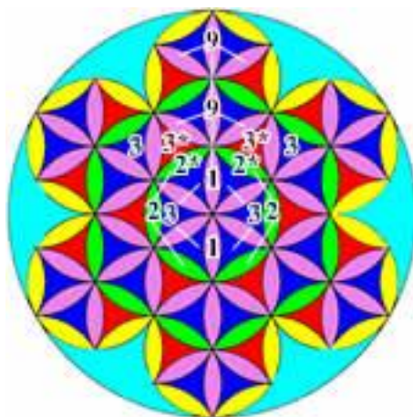
Рис.4 – Плод Жизни

3-й Этап. На втором круге все шесть наших «гиперболических треугольников» изменили свою ориентацию, и теперь их центральные вершины повёрнуты не внутрь цветка, а вовне, что делает возможным обращение к ним вершин трёх таких же треугольников, расположенных на следующем уровне. И вот, обведя эти треугольники шестью последними фиксирующими окружностями, мы как раз и получим ту самую фигуру, которую принято называть «Цветком Жизни» (см. Рисунок 5).