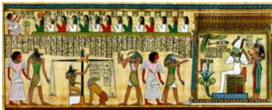
Рис.6 – Суд Осириса