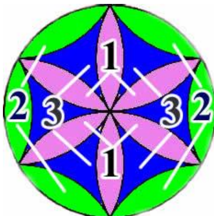
Рис.2 – Цветок Жизни (центральный круг)

лепестков, прилегающих к окружности (2); шесть заполняющих пространство между лепестками «гиперболических треугольников» с вершинами, повернутыми к центру (3).