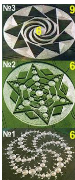
Рис.9 – Круги на полях