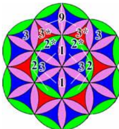
Рис.3 – Семя Жизни

В результате проделанных манипуляций, мы получим фигуру в форме «шестикрылой ромашки», которая обведена на Рисунке 3 вторым зелёным поясом. В «стандартной интерпретации» данная «ромашка» получила название «Семя Жизни».