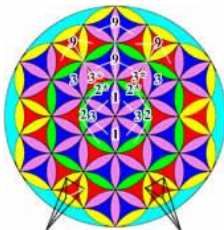
Рис.5 – Цветок Жизни (полный)

3-й Этап. На втором круге все шесть наших «гиперболических треугольников» изменили свою ориентацию, и теперь их центральные вершины повёрнуты не внутрь цветка, а вовне, что делает возможным обращение к ним вершин трёх таких же треугольников, расположенных на следующем уровне. И вот, обведя эти треугольники шестью последними фиксирующими окружностями, мы как раз и получим ту самую фигуру, которую принято называть «Цветком Жизни» (см. Рисунок 5).