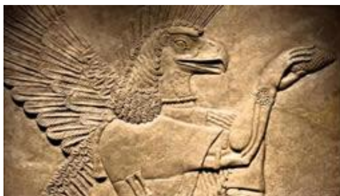
Рис.8 – Изображение «рептилоида-контролёра» (Древняя Месопотамия)