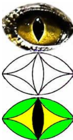
Рис.7 – «Крокодилий Глаз»